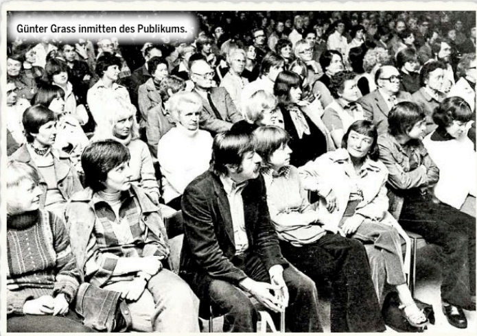
Günter Grass inmitten des Publikums.

Besonders in Erinnerung ist Gillmeister auch das große Kunstinteresse von Grass geblieben. „Meine Eltern hatten zuvor die Kunstgalerie eröffnet. Und auch Grass fertigte gern Zeich-