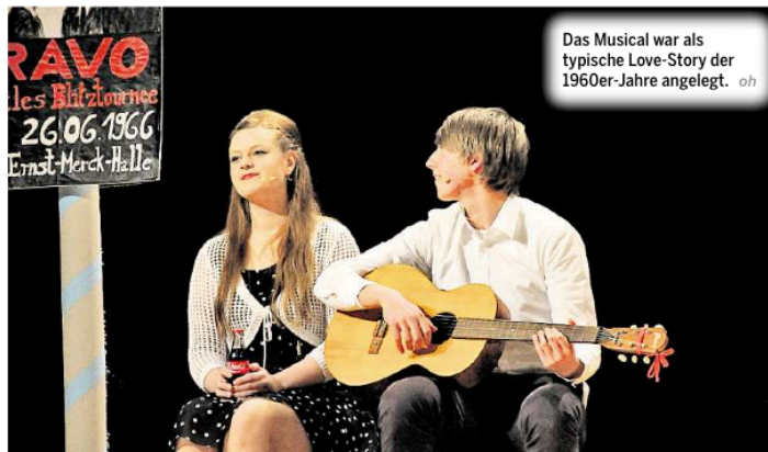
Das Musical war als typische Love-Story der 1960er-Jahre angelegt. oh

Seit nunmehr vier Jahren ist es gute Tradition am Ratsgymnasium, dass der Abiturjahrgang die Vorbereitung auf spezielle Themen des Zentralabiturs durch das Arrangieren von Theaterinszenierungen auch ganz praktisch angeht. Was lag da näher, als das im Zentralabitur 2015 gesetzte Musik-Thema „Beatles-Songs – Originale, Be-