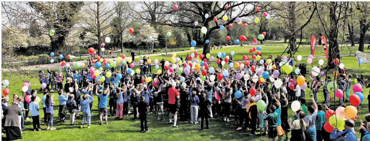
Auftakt zum Hochbegabtenverbund Peine II: Rund 350 Schüler haben gestern im Stadtpark nach dem Sternlauf Luftballons steigen lassen.