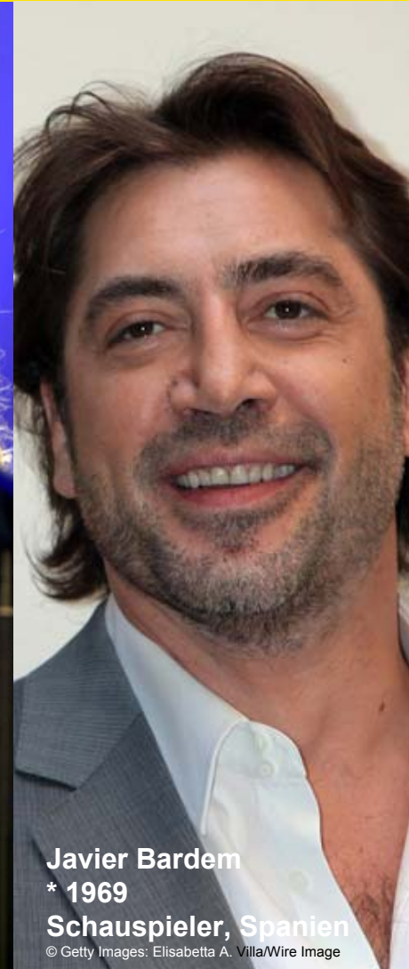
Javier Bardem * 1969 Schauspieler, Spanien