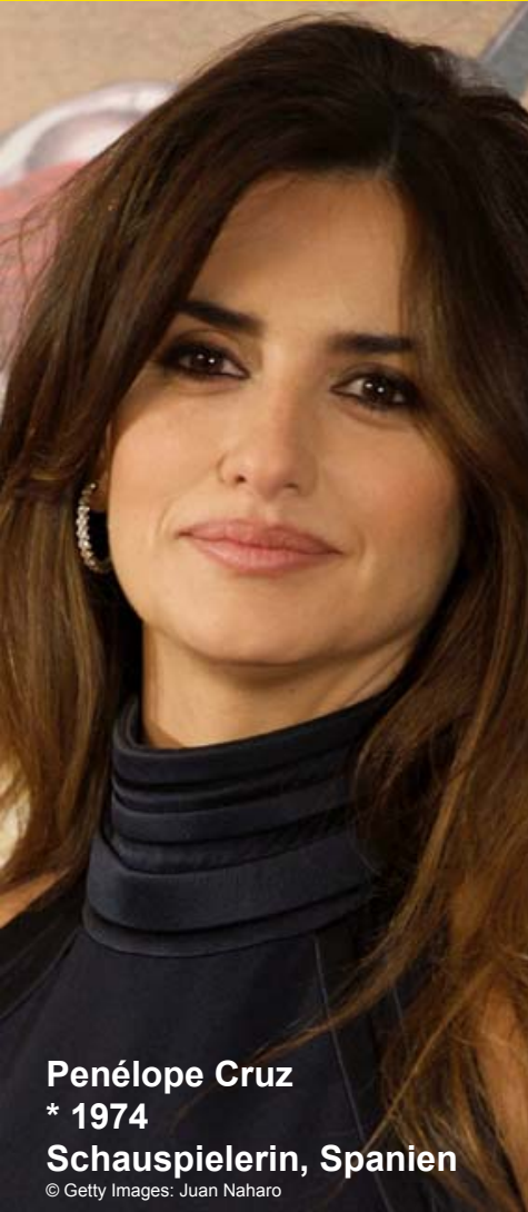
Penélope Cruz * 1974 Schauspielerin, Spanien