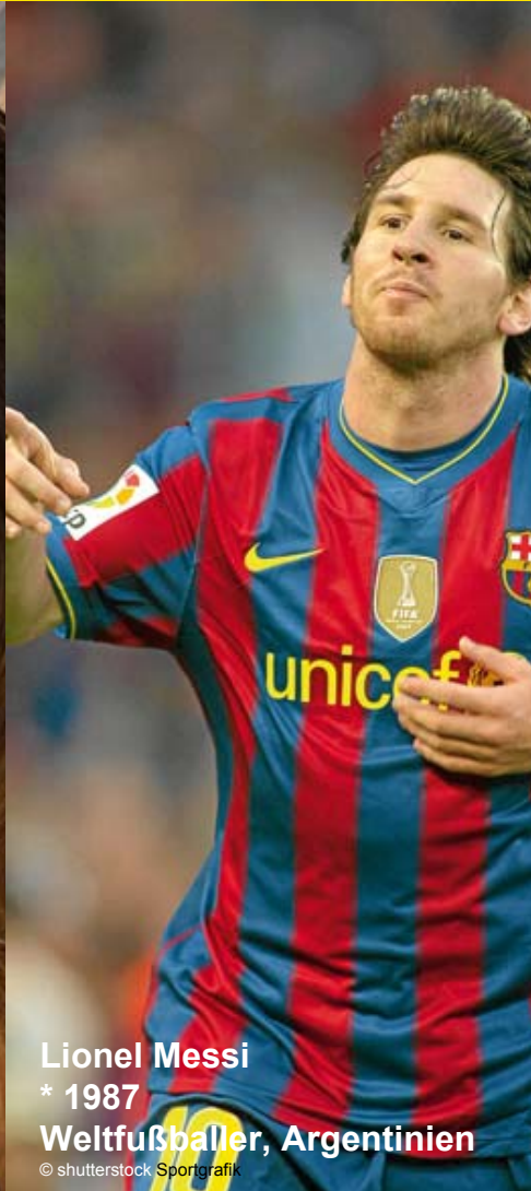
Lionel Messi * 1987 Weltfußballer, Argentinien Sportgrafik